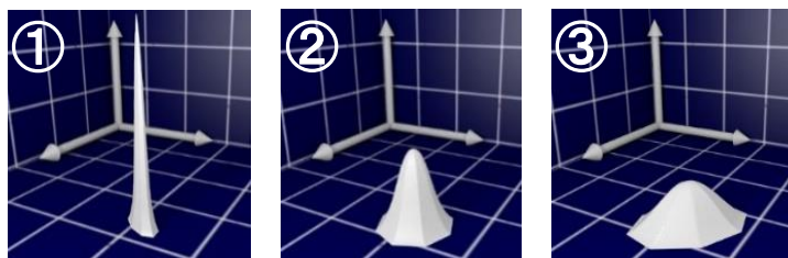
図2 色の積算データの3Dイメージ図 (z軸はCount値)

図1を3次元で模式的に描くと図2のような山型になります。 基本的にはメタリック感が強いほど、低く広がった山型となります。山の形は違いますが、面積は等しくなっています。